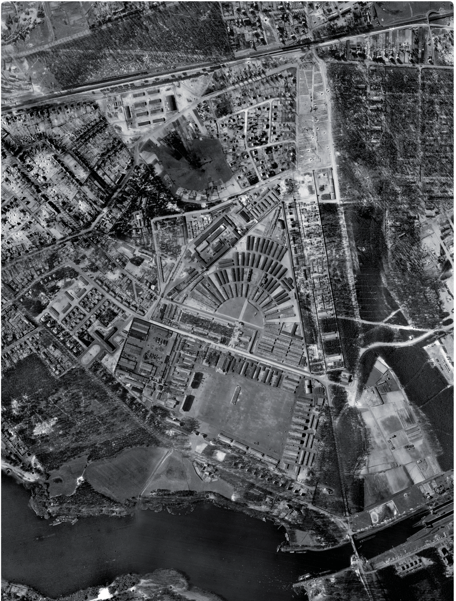
Luftbild aus dem Jahr 1945 von dem Gelände, auf dem sich heute unter anderem die Fachhochschule der Polizei und die Gedenkstätte des Konzentrationslagers Sachsenhausen befinden.